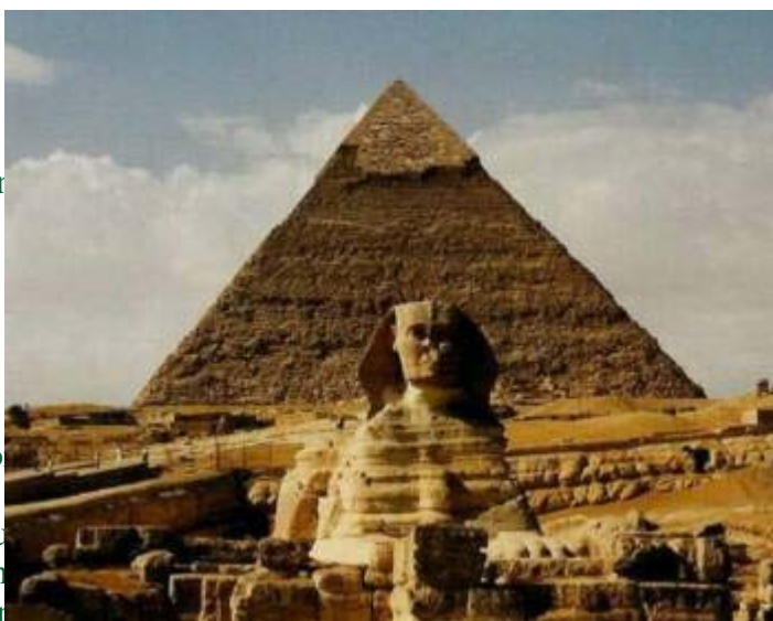
Sfinxen och Chefrenpyramiden i Giza, Egypten

Bulgarien: Leva (BGN) Egypten: Pund (EGP) Frankrike: Euro (EUR) Grekland: Euro (EUR) Hongkong: Dollar (HKD) Indien: Rupee (INR) Indonesien: Rupee (IDR) Israel: Sheqel (ILS) Italien: Euro (EUR) Jamaica: Dollar (JMD) Kina: Yuan (CNY) Kroatien: Kuna (HRK) Kuba: Peso (CUP) Malaysia: Ringgit (MYR) Marocko: Dirham (MAD) Peru: Nuevo Sol (PEN) Singapore: Dollar (SGD) Slovenien: Tolar (SIT) Storbritannien: Pund /Sterling Pund (GBP) Sydafrika: Rand (ZAR) Thailand: Bath (THB) Turkiet: Lira (TRL) Tyskland: Euro (EUR) USA: Dollar (USD)