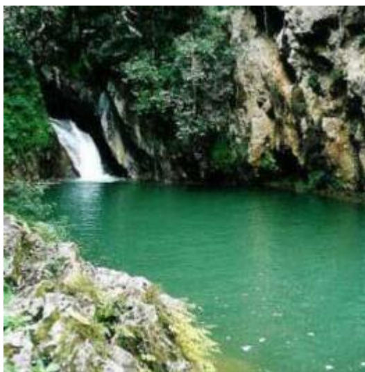
Vattenfall i Topes de Collantes utanför Trinidad, Kuba.