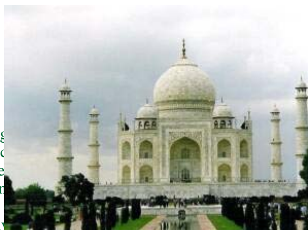
Taj Mahal i Agra, Indien

För kvinnor tillkommer naturligtvis intimitygsartiklar. Förvara artiklar som rakskum, hårgelé och schampo i originalförpackningen eller behållaren skulle läcka eller gå sönder underlättar det om man har en gemensam tar